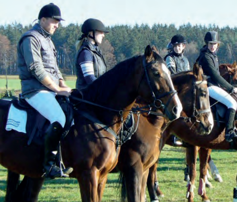
📍 Farma Simandl