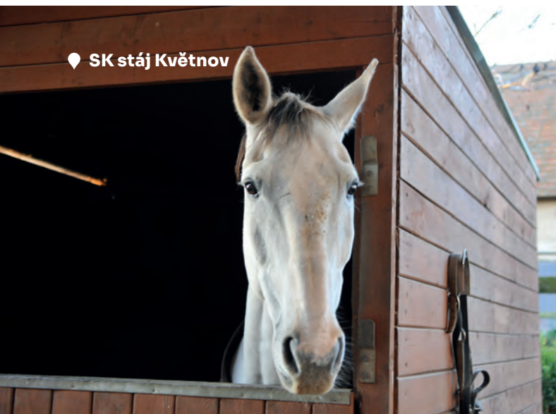
📍 SK stáj Květnov