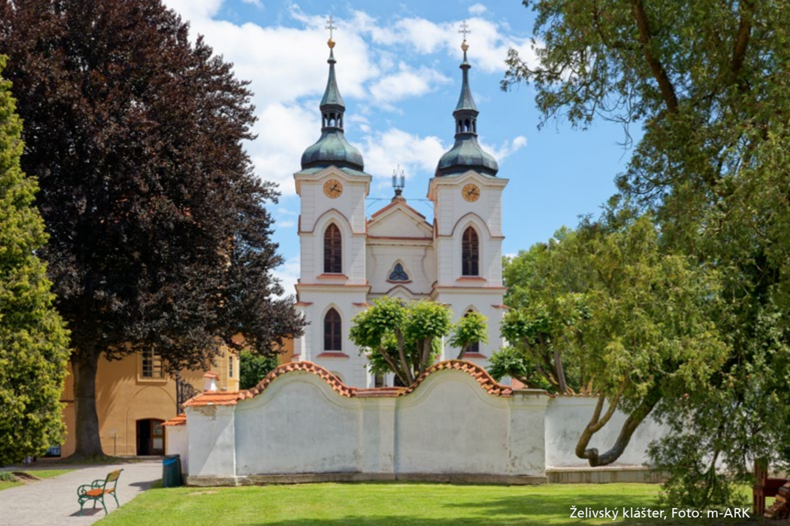
Želivský klášter