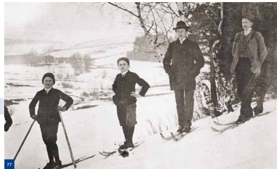
Lyžování má v Novém Městě více než stoletou tradici. Začal s ním hajný. IDNES.cz Jihlava a Vysočina [online]. Jihlava: MAFRA, 2013 [cit. 2017-10-30]. Dostupné z: jihlava.idnes.cz/historie-lyzovani-v-novem-meste-na-morave-fip-jihlava-zpravy.aspx?c=A130212_1888539_jihlava-zpravy_mkk

Štafety na Harusově kopci – v pozadí bývalá turistická chata, která roku 1942 vyhořela.