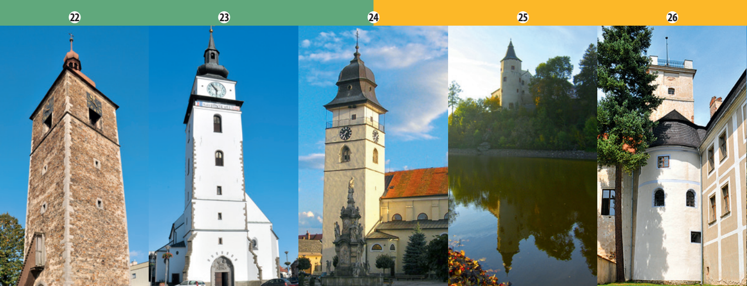
22. VĚŽ U KOSTELA SV. JANA KŘTITELE, Příbyslav 23. VĚŽ ZÁMKU ŽIROVNICE 24. VĚŽ ZÁMKU POLICE 25. VĚŽ ZÁMKU ŽDĀR NAD SÁZAVOU 26. VĚŽ ZÁMKU LIPNICE NAD SÁZAVOU

22. VĚŽ U KOSTELA SV. JANA KŘTITELE, Příbyslav S výstavbou příbyslavské gotické věže se začalo v roce 1497. Její mohutné zdi dávají tušit, že byla stavěna jako věž obranná, vchod do ní je umístěn až ve výšce 7 m. V roce 1994 věž dostala dva nové zvony se jmény Maria a Jan o váze 395 kg a 293 kg. ➤ Výška: 30,96 m ➤ Otevírací doba: Červen–srpen, st–ne: 9:00–11:00, 13:00–16:00. ➤ Adresa: Bechyňovo náměstí 45, Příbyslav (IC) www.kzmpribyslav.cz