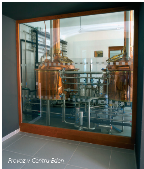
Provoz v Centru Eden