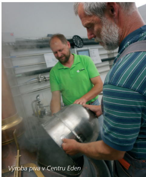
Výroba piva v Centru Eden