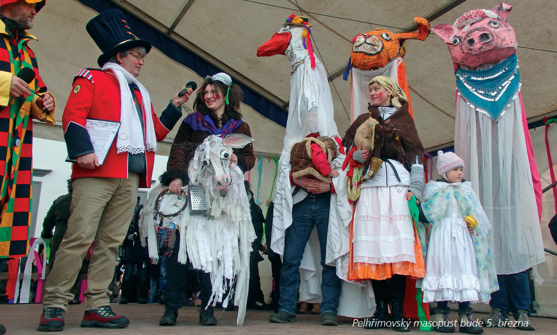
Pelhřimovský masopust bude 5. března