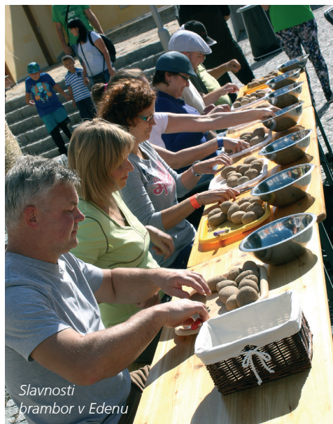
Slavnosti brambor v Edenu

Tradiční biblický příběh o narození Ježíše Krista, který odehrají desítky herců na prostranství u kostela v Měříně. www.merin.cz