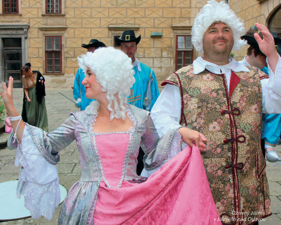
Oživený zámek v Náměstí nad Oslavou

30. dubna NÁMĚŠŤ NAD OSLAVOU SLET ČARODĚJNIC