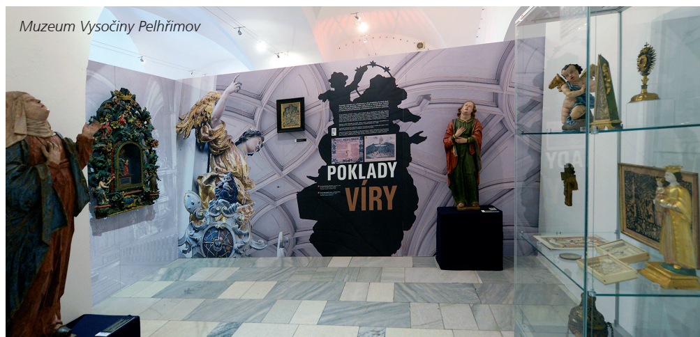
Muzeum Vysočiny Pelhřimov