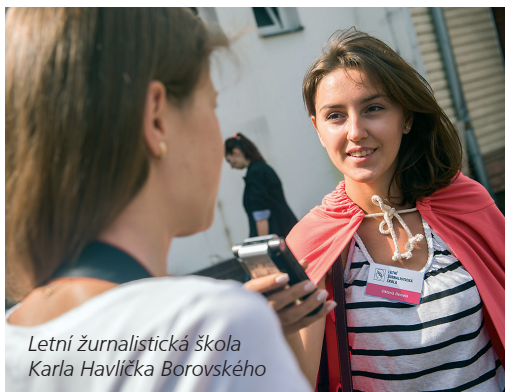
Letní žurnalistická škola Karla Havlíčka Borovského