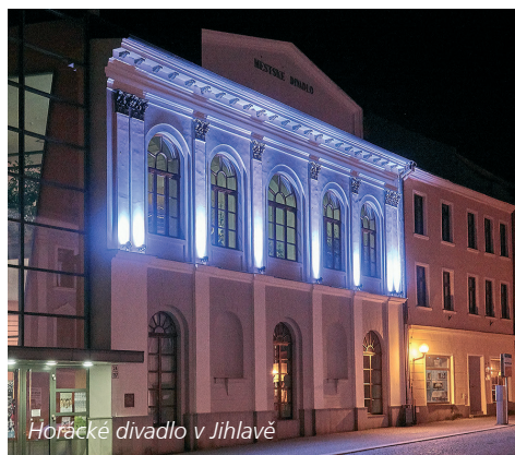
Horácké divadlo v Jihlavě

Každoročně divadlo zahajuje sezonu na Den otevřených dveří památek v rámci akce Dny evropského dědictví. V tento den návštěvníci absolují nové formy prohlídek divadla a herci, ale i další pracovníci ze zákulisí, se rádi potkají se svými diváky.