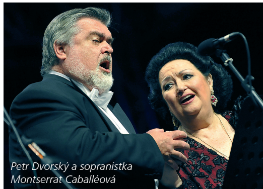
Petr Dvorský a sopránistka Montserrat Caballéová