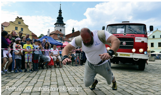
Pelhřimov – město rekordů

Přehlídka hraček z přírodního materiálu, tvůrčí dílny a bohatý doprovodný program. www.hrackobrani.cz