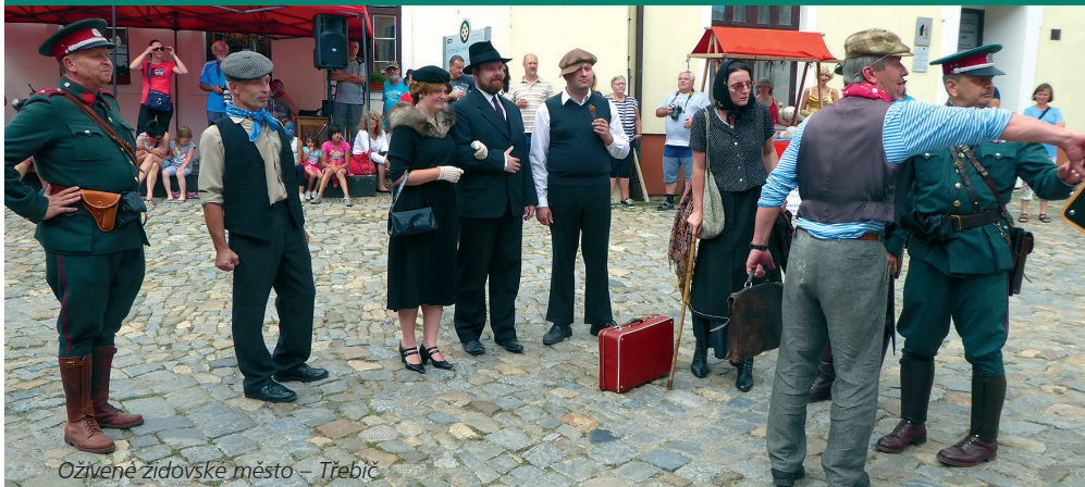
Oživené židovské město – Třebíč

Židovská čtvrť v Třebíči, památka UNESCO, se každoročně v červenci probouzí do dob první republiky. Četníci dohlížejí na dodržování pořádku, pouliční umělci baví a potulní muzikanti vyluzují podmanivé tóny. Kulturně-historická slavnost si za svých sedm ročníků získala řadu příznivců a letos židovskou čtvrť oživí 12. až 14. července. www.ozizim.tode.cz