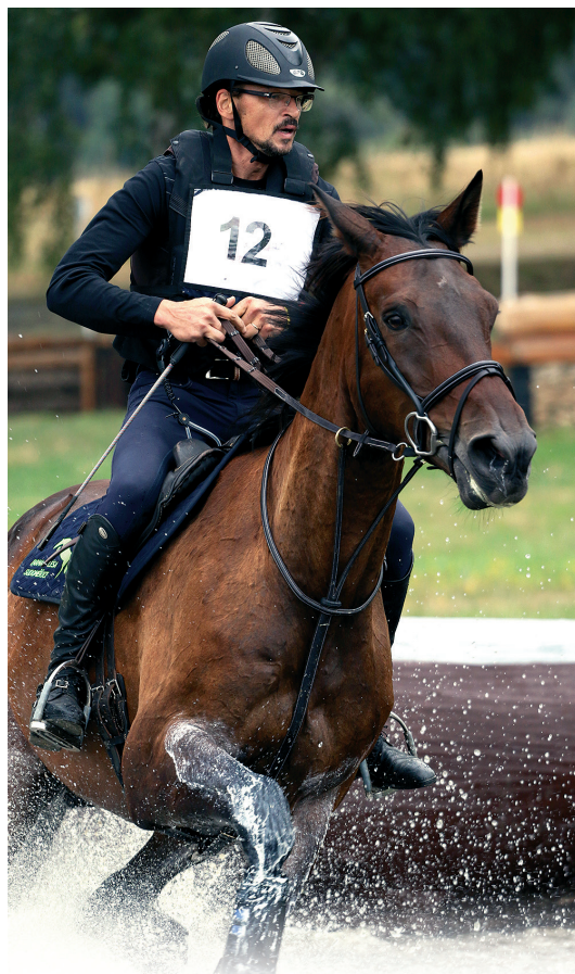
Zlatá podkova Humpolec

Mezinárodní plavecké závody zařazené do programu Českého poháru v plavání. www.jpaxis.cz