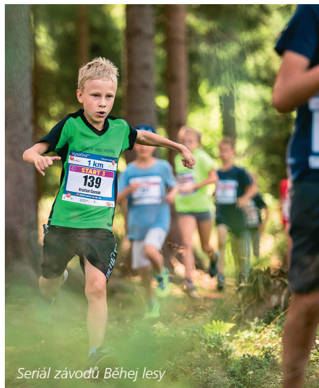
Seriál závodů Běhej lesy