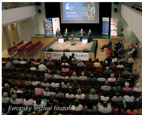
Evropský festival filozofie