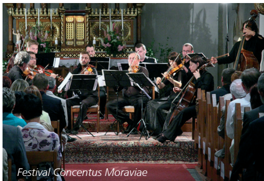
Festival Concertus Moraviae