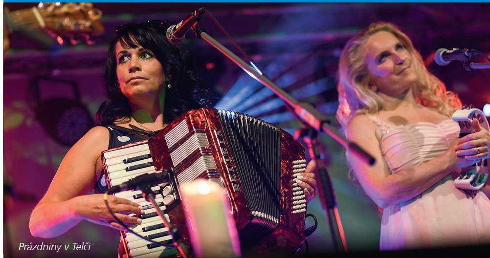
Prázdniny v Telči

Telč v létě opravdu žije a velkou zásluhu na tom mají Prázdniny v Telči – vícežánrový festival trvající 17 dní, který letos odstartuje 26. července. Do města UNESCO se přijíždí podívat hvězdy české a country scény, novějším doplňkem programu je filmová sekce, jež nabízí filmy s hudební tematikou, a děti zase potěší pohádky pod vrbou. Prázdniny lákají i na víkendové výletní jízdy parního vlaku na trati Kostelec, Třešť, Telč, Dačice a Slavonice. www.prazdninyvtelci.cz