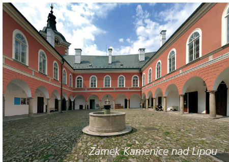
Zámek Kamenice nad Lipou