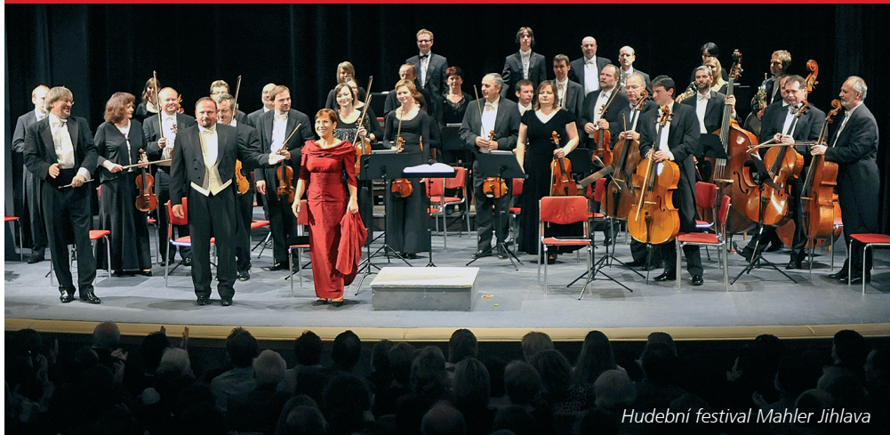
Hudební festival Mahler Jihlava

Hudební festival věnovaný hudebnímu velikanovi spjatému s Jihlavou a jeho 18. ročník potěší nejedno srdce a nejednu duši. Festival každoročně představuje velká symfonická díla Gustava Mahlera v konfrontaci s díly jeho současníků a následovníků. Součástí festivalu je i bohatý doprovodný program, který například zahrnuje Cyklocestu po stopách Gustava Mahlera. Letos se uskuteční od 18. května do 7. července. www.mahler2000.cz