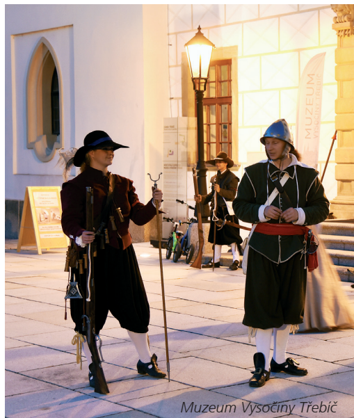
Muzeum Vysočiny Třebíč