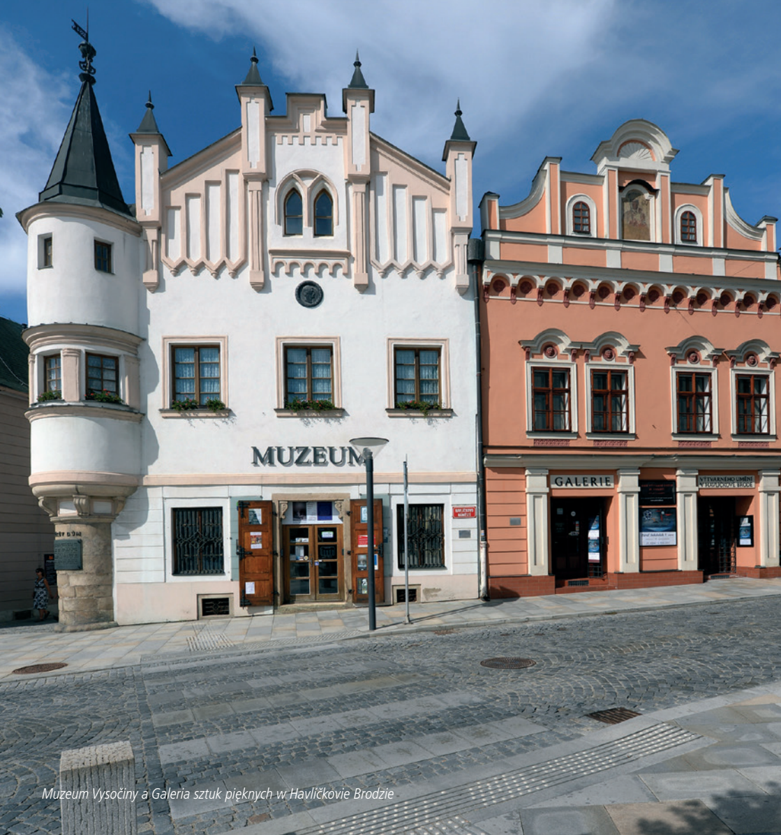
Muzeum Vysočiny a Galeria sztuk pięknych w Havlíčkovie Brodce