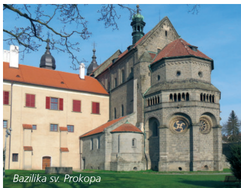
Bazilika sv. Prokopa