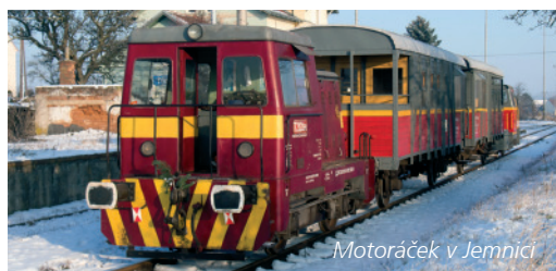
Motoráček v Jemnici

Výletní vlak tažený lokomotivou vyrobenou v roce 1976 se prohání na trase Jemnice – Moravské Budějovice. Můžete se jím svést buď na speciálních