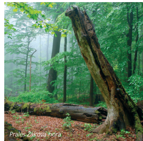
Prales Žákova hora

Žďárské vrchy můžeme bez nadsázky označit za nejrozmantější část Českomoravské vrchoviny. Jsou pramennou oblastí několika řek a téměř polovinu území pokrývají hluboké lesy, ze kterých vystupují skalní rulové útvary. Za návštěvu mimo jiného stojí Žákova hora, skalní útvar Čtyři palice (27) u obce Křížánky, rybníky Velké Dářko (28), Medlov nebo Sykovec. Chráněná krajinná oblast Želené hory se na Vysočině rozkládá kolem Chotěboře a Ždírcu nad Doubravou. Mezi obcí Bílek a městem Chotěboř najdete přírodní rezervaci – skalnaté údolí řeky Doubravy (29). Úzký, strmý kaňon řeky Doubravy je zmenšeným obrazem obřích kaňonů nacházejících se jinde ve světě. Údolí je však neméně krásné, romantické a tajuplné.