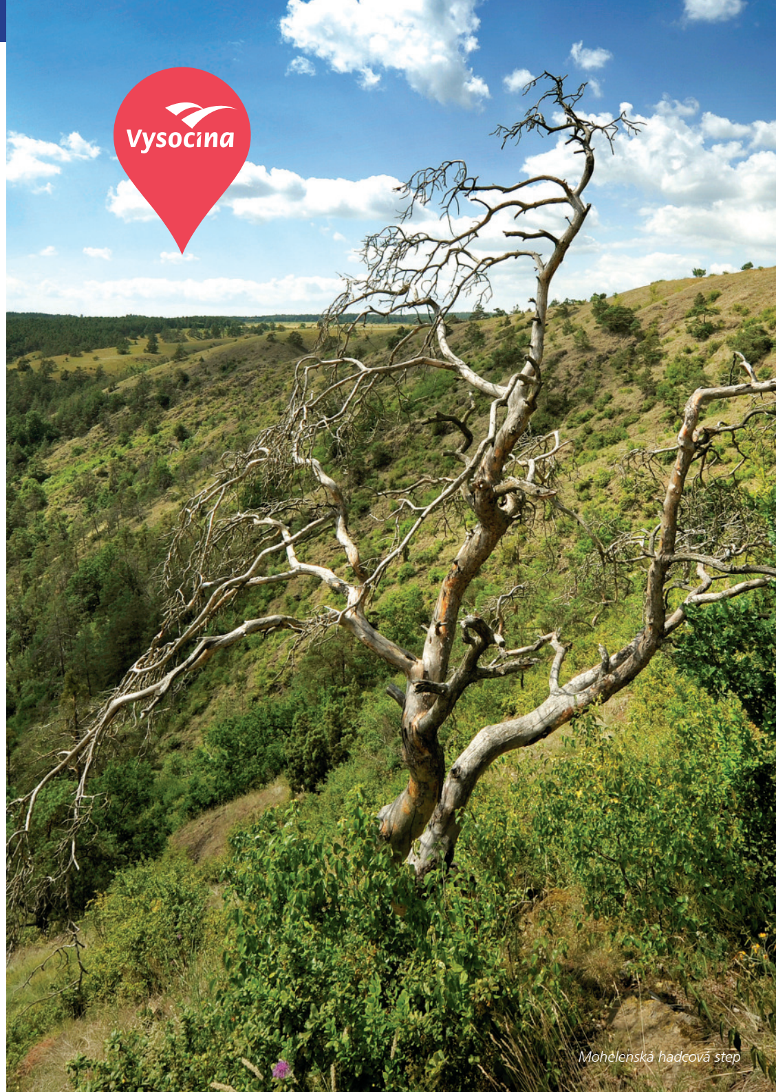
Mohelenská hadcová step