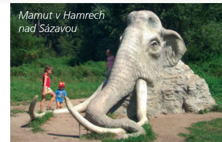
Mamut v Hamrech nad Sázavou