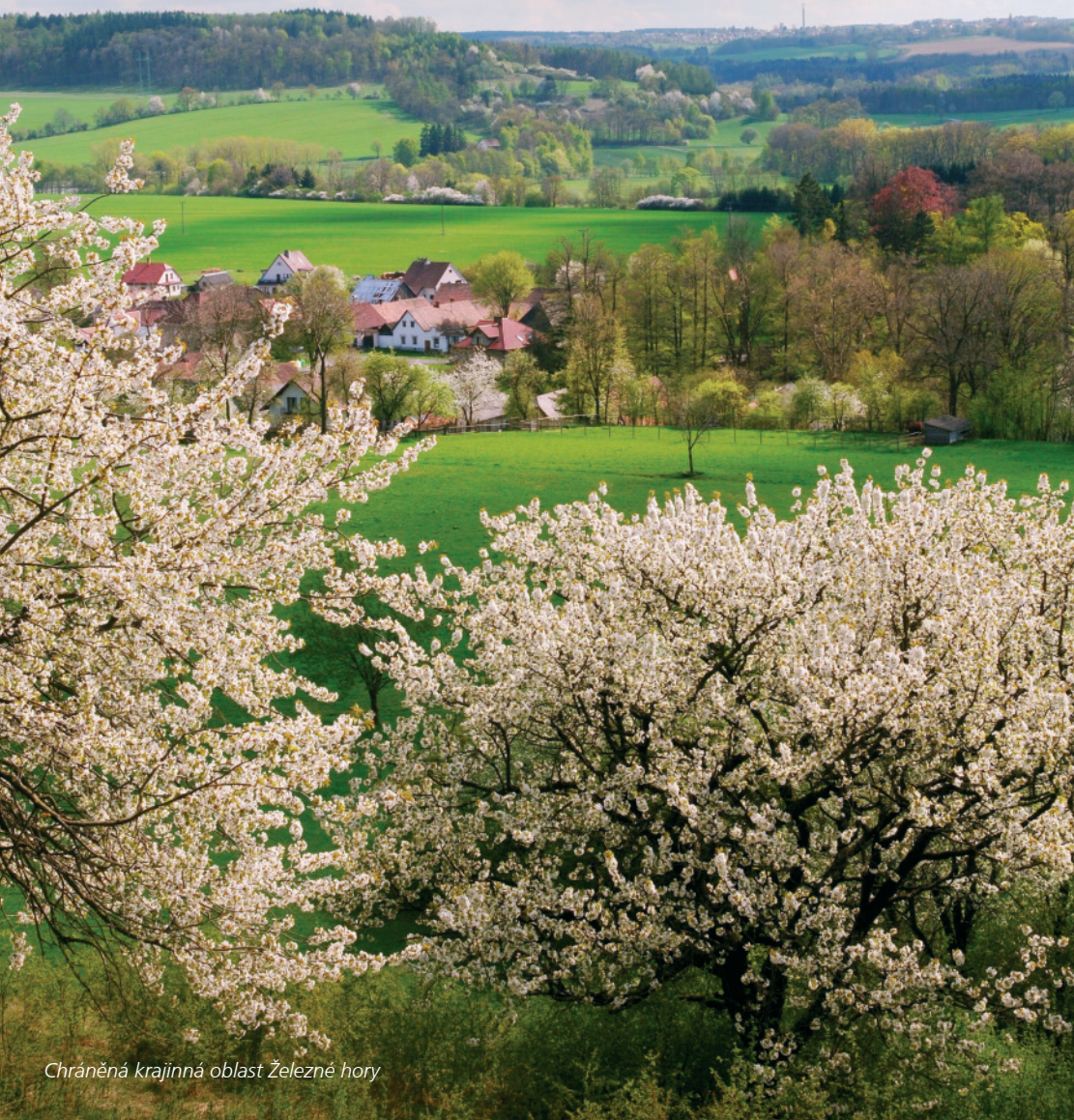
Chráněná krajinná oblast Železné hory