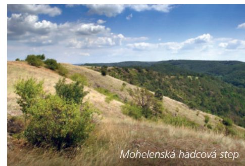
Mohelenská hadcová step

Přírodní krásy objevíte i na Třebíčsku a Pelhřimovsku. Nejvyšším vrcholem Pelhřimovska je Křemešník (765 m) – (32), kde byla v roce 1985 vyhlášena stejnojmenná přírodní rezervace. Na kopce, louky a lesy můžete pohlednout z výšky – na vrchu totiž stojí rozhledna Pí-palka a okolo vrchu vede Naučná stezka Křemešník. Příroda Třebíčska je zase známá jedinečným unikátem – národní přírodní rezervací Mohelenská hadcová step (33). Neznámější step na území Česka se rozkládá nedaleko Jaderné elektrárny Dukovany a unikátní je svou flórou i faunou, se kterou vás seznámí stejnojmenná naučná stezka.