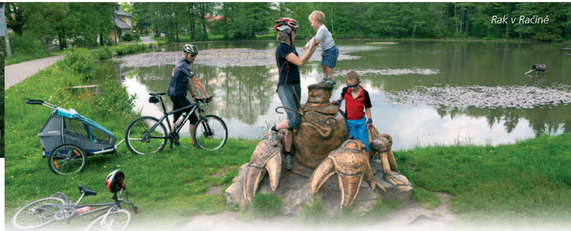
Rak v Račině

Jak vypadá takový Mamlas, se dozvíte, když se rozhodnete udělat malý cyklovýlet po sochách žďárského umělce, sochaře Michala Olšiaka. V okolí Žďáru nad Sázavou i v dalších místech po Vysočině vytvořil plastiky z betonu, které objevíte v lesích i v centrech obcí. Například se můžete vydat z Polničky přes areál Pílské nádrže (tzv. Pilák), do Račina až k přehradě Velké Dářko zpět do Polničky, kde na děti čeká areál Salón Expres Vagón. Nebo zvolit cyklovýlet ze Žďáru do osm kilometrů vzdálené Sázavy a v Hamrech nad Sázavou objevit sochu Hamroně nebo v blízkosti technické památky Šlakhamr Mamuta. www.olsiak.cz 22 23