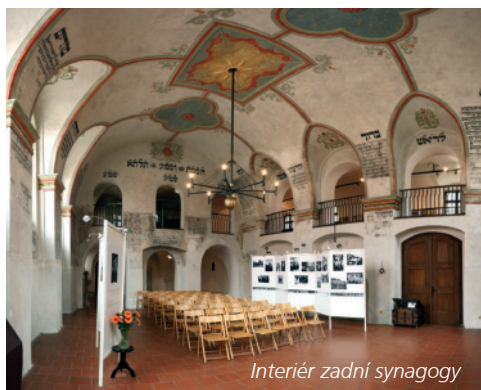
Interiér zadní synagogy

Bazilika sv. Prokopa vyrostla v době, kdy se ve Francii začaly k nebi vzpínat první gotické katedrály. Jediné prolnutí evropských vlivů na pomezí románského a gotického slohu vedlo v roce 2003 k zapsání této unikátní stavby na seznam UNESCO. Na seznamu figuruje také přilehlý valdštejnský zámek, bývalý klášter, kde dnes sídlí Muzeum Vysočiny Třebíč. To v atraktivních historických prostorách vytvořilo moderní expozice zaměřené například na dějiny původně benediktinského kláštera nebo na živou i neživou přírodu.