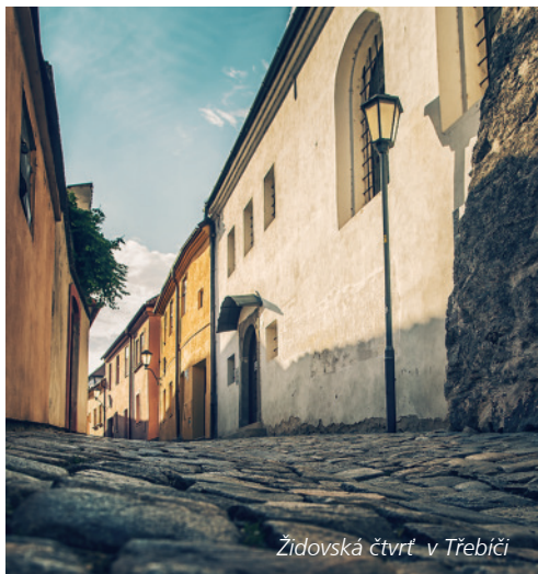
Židovská čtvrť v Třebíči

Třebíč zdobí jedna z mála kompletně dochovaných židovských čtvrtí v Evropě a jediná židovská památka UNESCO mimo území Izraele. Historii tamějšího židovského obyvatelstva dokumentuje Zadní synagoga, která byla postavena roku 1669 v renesančním slohu. V ní si mimo jiného můžete prohlédnout model židovského ghetta – jak vypadalo v roce 1850. K procházce vybízí malebná čtvrť úzkých uliček a zachovalých domů. Spolu s židovskou čtvrtí byl na seznam UNESCO v roce 2003 zapsán také židovský hřbitov. Ten se svou rozlohou bezmála 12 tisíc m 2 , 11 tisíci hroby a téměř třemi tisíci kamenných náhrobků řadí k největším židovským pohřebištím v zemi.