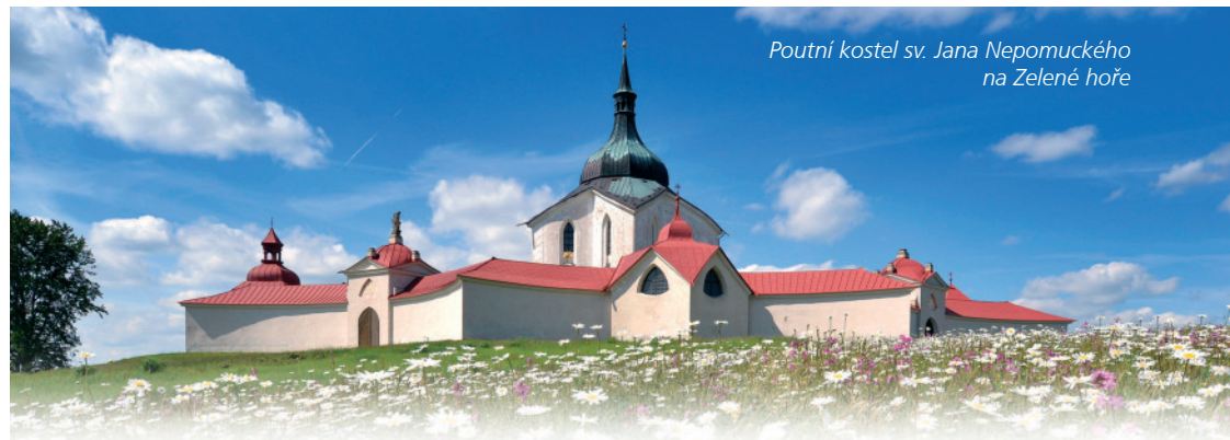
Poutní kostel sv. Jana Nepomuckého na Zelené hoře

Na horním toku řeky Sázavy, v samém srdci Českomoravské vrchoviny, leží v krásné přírodní scenérii chráněné krajinné oblasti Žďárské vrchy město Žďár nad Sázavou, které také najdeme na mapě památek UNESCO, a to díky skvostu barokní architektury, poutnímu kostelu sv. Jana Nepomuckého na Zelené hoře. Ten byl na seznam kulturního a přírodního dědictví zapsán v roce 1994.