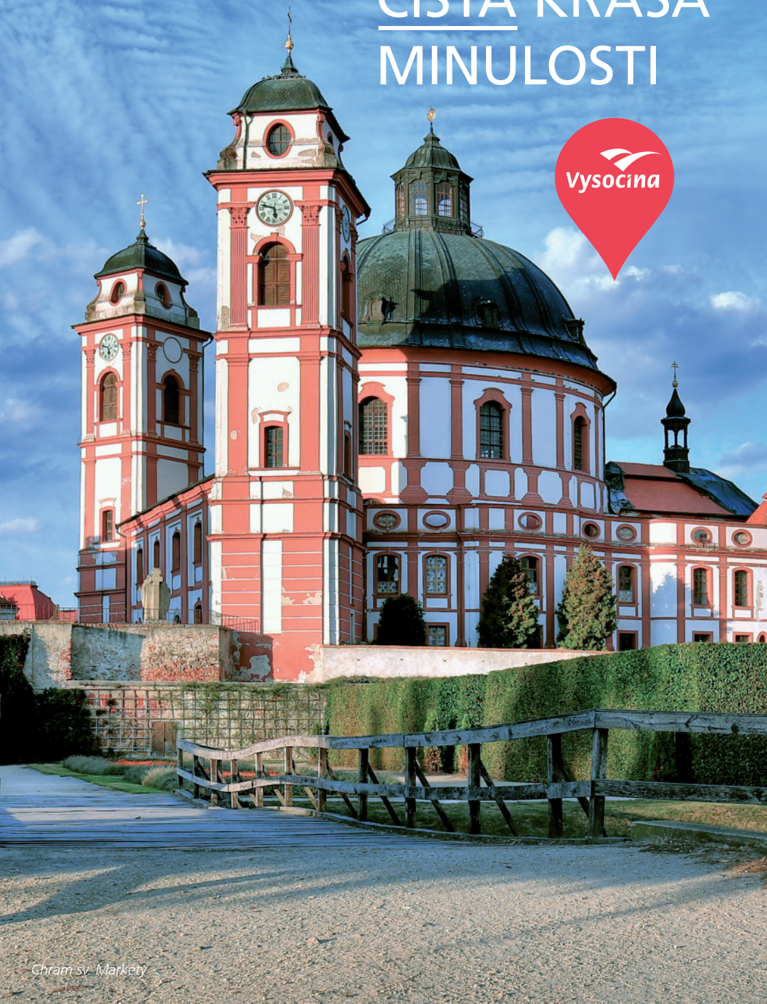
Chrám sv. Markéty