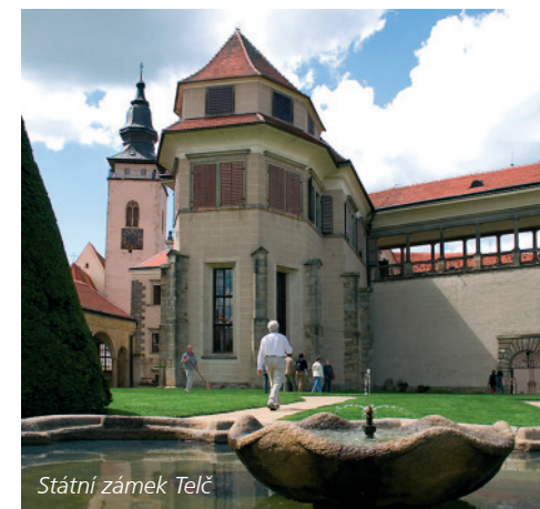
Státní zámek Telč

Za návštěvu rozhodně stojí renesanční zámek, který se za slunného počasí rád zrcadlí na hladině rybníka. Mezi hlavní lákadla patří Rytířský a Zlatý sál a kaple Všech svatých i zahrada s arkádami a zámecký park. Krásky tohoto místa si velmi rychle všimli filmaři, kteří tady natočili několik pohádek.