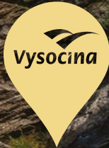
Vírské ferraty.