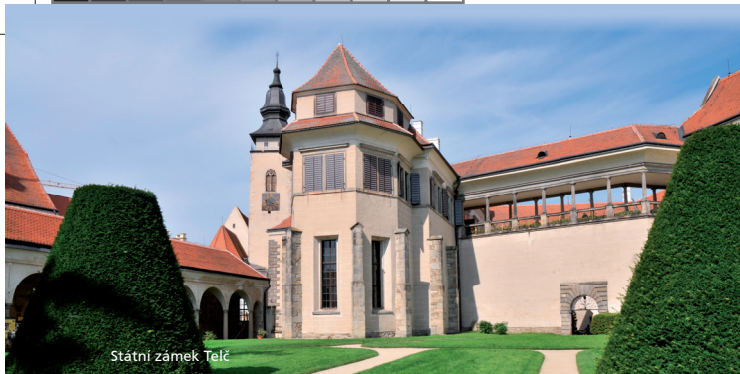
Státní zámek Telč