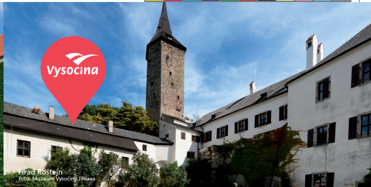
Hrad Roštejn