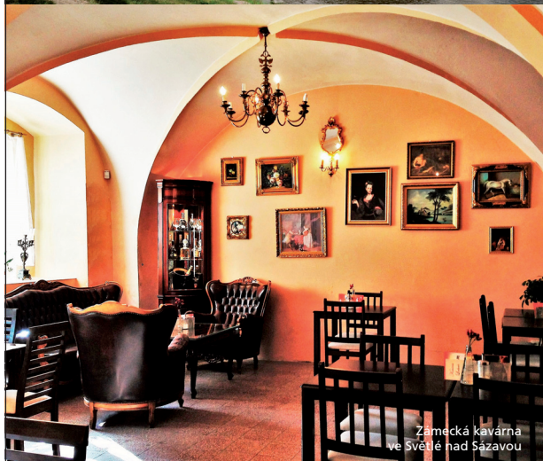
Zámecká kavárna ve Světlé nad Sázavou

Příroda se probouzí a s ní i hrady, zámky a další památky na Vysočině. Letos budou návštěvníky lákat na stoleté výročí od založení ČSR a život v první republice. Například na Státním zámku v Náměšti nad Oslavou se v době prázdnin v rámci večerní prohlídky odehraje detektivní příběh z doby první republiky, na zámku ve Světlé nad Sázavou připravují od 2. června novou prohlídkovou trasu se sto let starým nábytkem, šperky nebo prvorepublikovou módou a nová brožura Sto let příběhů, lidských osudů, architektury i sportu a kultury na Vysočině odhaluje téměř zapomenuté příběhy a nabízí pět výletních okruhů po stopách historie dnešních měst a obcí Vysočiny. Ke stažení je na tematickém webu www.vysocina100let.cz , kde najdete i pozvánky na akce spojené se stoletým výročím na Vysočině.