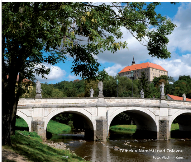
Zámek v Náměšti nad Oslavou