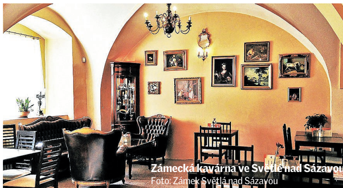
Zámecká kavárna ve Světlé nad Sázavou

Po jednotlivých městech Vysočiny budou putovat akrobati s jedinečnou show a pyrotechnickými efekty, aby pozvali na velkolepou společnou krajskou oslavu. 15. září se jihlavské Masarykovo náměstí promění ve velké jeviště, na kterém se ode-